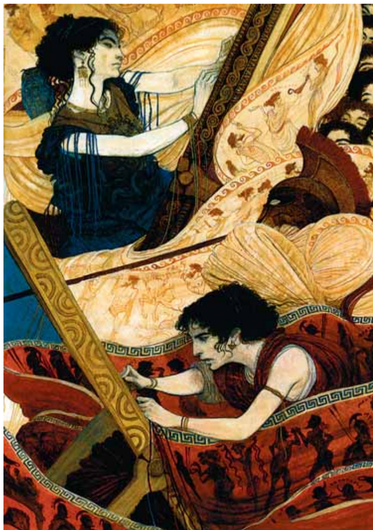
SVETLIN (VICENS VIVES)

La lectura la podríem complementar amb dues eines ja bàsiques de la interpretació moderna de la cultura hel·lenística. D'una banda, Destino publica Història dels grecs , del reputat i controvertit periodista italià Indro Mon-